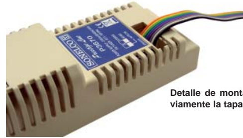
Detalle de montaje, rasgando previamente la tapa del módulo P3670